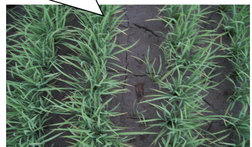
中干し終了時の田面の目安