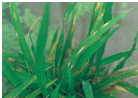
葉いもち（作物病害辞典より）