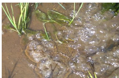
ワキが発生した圃場に足を踏み入れた時の様子

また、今年は藻が発生している圃場が多く見られます。藻が多発していると圃場の水温・地温が上がりにくくなるので、水交換や田干しを行って、発生を抑えましょう。