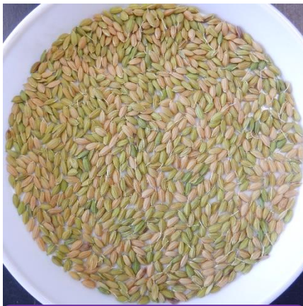
8/21 青籾歩合 85%程度

登熟促進や 胴割粒、白未熟粒の発生軽減のため、落水は必ず出穂後 30 日以降 とします。