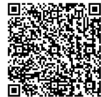
↑ヨード反応指数の調査法