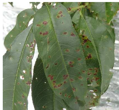
図2 多発した発病葉